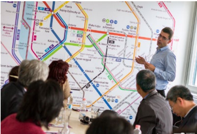
Spotkanie interesariuszy w Budapeszcie