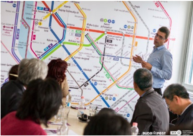
Réunion des parties prenantes à Budapest