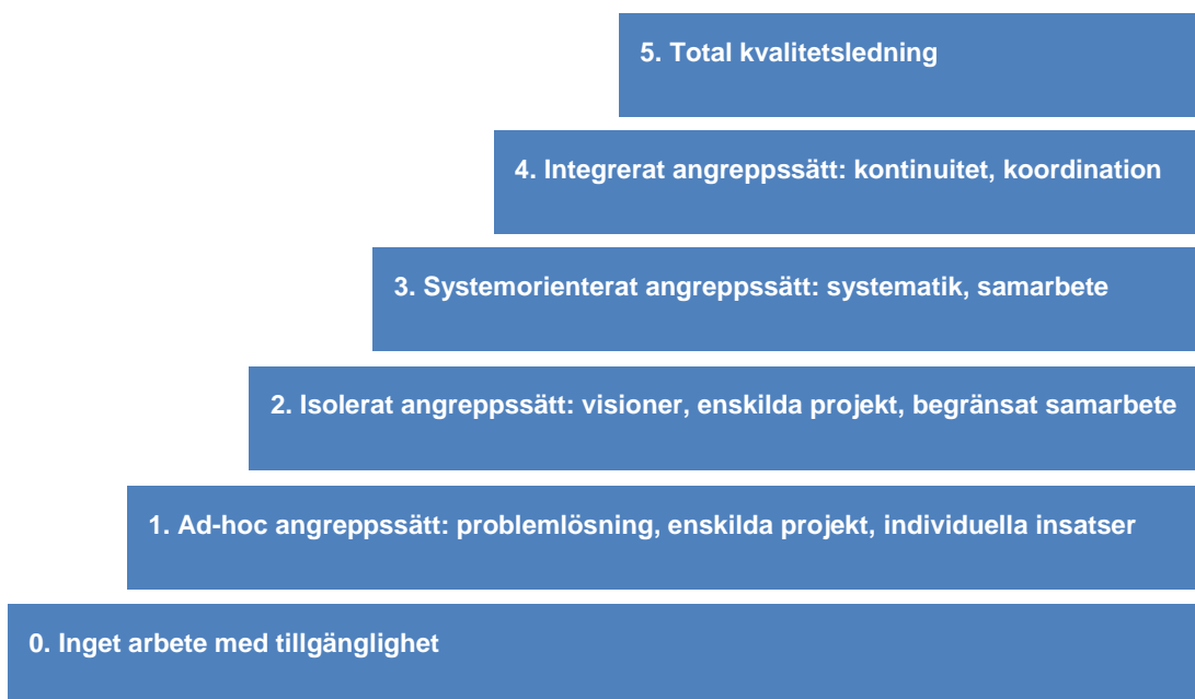
Figur 2. Utvecklingstrappan

ISEMOA:s tillgänglighetsrevision är inte normativ. Den kräver att kommunen tar en aktiv roll i att undersöka och utvärdera sitt nuvarande tillgänglighetsarbete med hänsyn tagen till de 16 element som presenterades i avsnittet ovan, för att sedan bestämma sig för hur förändringar i en del av dessa element ytterligare skulle kunna förbättra arbetet. För att bedöma kommunens tillgänglighetsarbete inom vart och ett av dessa 16 element används en utvecklingstrappa för att tydliggöra en kommuns utvecklingsstadium. Sex utvecklingsstadium finns, se Figur 2.