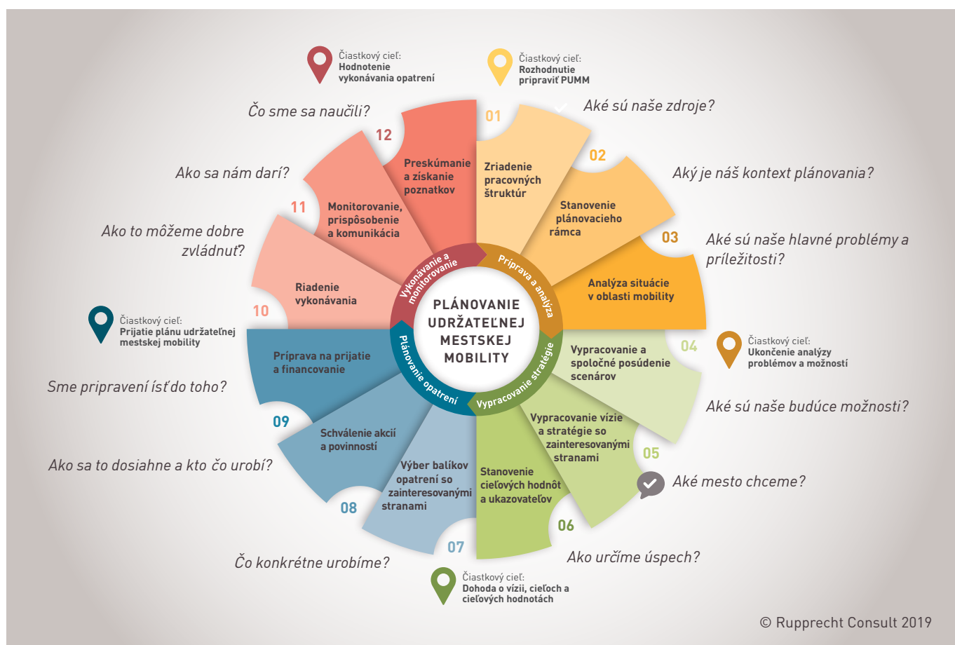
Figure 1: 12 krokov plánovania udržateľnej mestskej mobility [2. vydanie] – Prehľad pre subjekty s rozhodovacími právomocami

Toto je, samozrejme, idealizované a zjednodušené vyjadrenie zložitého procesu plánovania. V niektorých prípadoch sa kroky môžu vykonávať takmer súbežne (alebo dokonca aj prehodnocovať), poradie úloh možno príležitostne prispôbovať konkrétnym potrebám alebo činnosť možno čiastočne vynechať, pretože jej výsledky sú k dispozícii z iného plánovacieho výkonu. Cyklus PUMM sa napriek všetkému osvedčil ako užitočné usmernenie, ktoré pomáha vytvárať štruktúru procesu plánovania a sledovať ho.