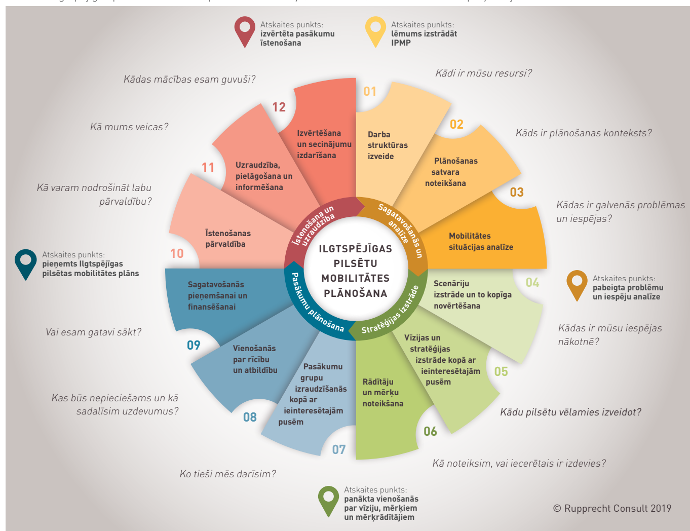
1. attēls. Ilgtspējīgas pilsētu mobilitātes plānošanas 12 soļi (2. izdevums). Pārskats lēmumu pieņēmējiem

Tas, protams, ir idealizēts un vienkāršots sarežģīta plānošanas procesa attēlojums. Atsevišķos gadījumos soļus var veikt gandrīz paralēli (vai pat atgriezties pie tiem vēlāk), dažkārt uzdevumu secību var pielāgot konkrētām vajadzībām vai kādu pasākumu var daļēji izlaist, jo tā rezultāti jau ir pieejami no cita plānošanas procesa. Tomēr ir pierādījies, ka IPMP cikls ir noderīgs satvars, kas palīdz strukturēt plānošanas procesu un sekot tam līdzi.